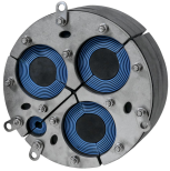
H3+1 UG™ yalıtım malzemesi